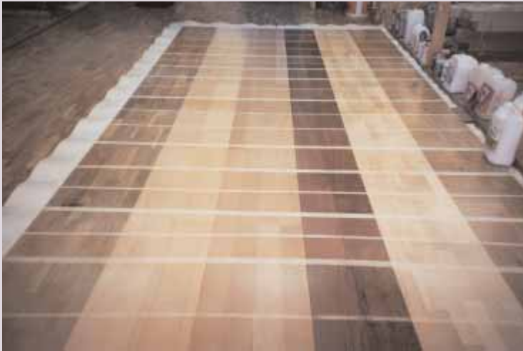
De monsterborden bestaan uit zes verschillende houtsoorten en zijn verdeeld in banen per product

JAN VAN DER KROEF heeft monsterborden gemaakt, bestaande uit 6 houtsoorten: eiken, maple, jatoba, gestoomd beuken, beuken naturel en eiken rustiek. Zo kan het effect worden gezien op houtsoorten met hun specifieke kenmerken, verschillende tinten en verschillende zuigkracht.